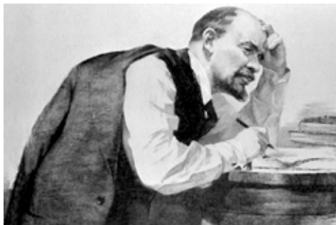
«Ленин за работой» . Давид Боровский, Марк Клионский. Графика, 1959 год