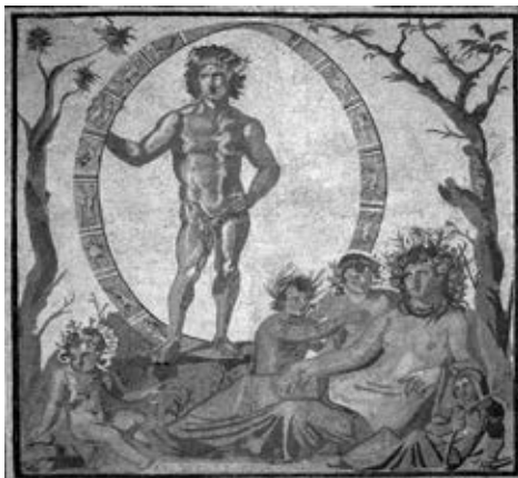
Уран и Гея – герои «Теогонии» Гесиода. Древнеримская мозаика

Е.П. Блаватская писала, что Фохат является ключом ко всей мифологии: и Вишну, и Осирис, и высший Дионис – его олицетворения.